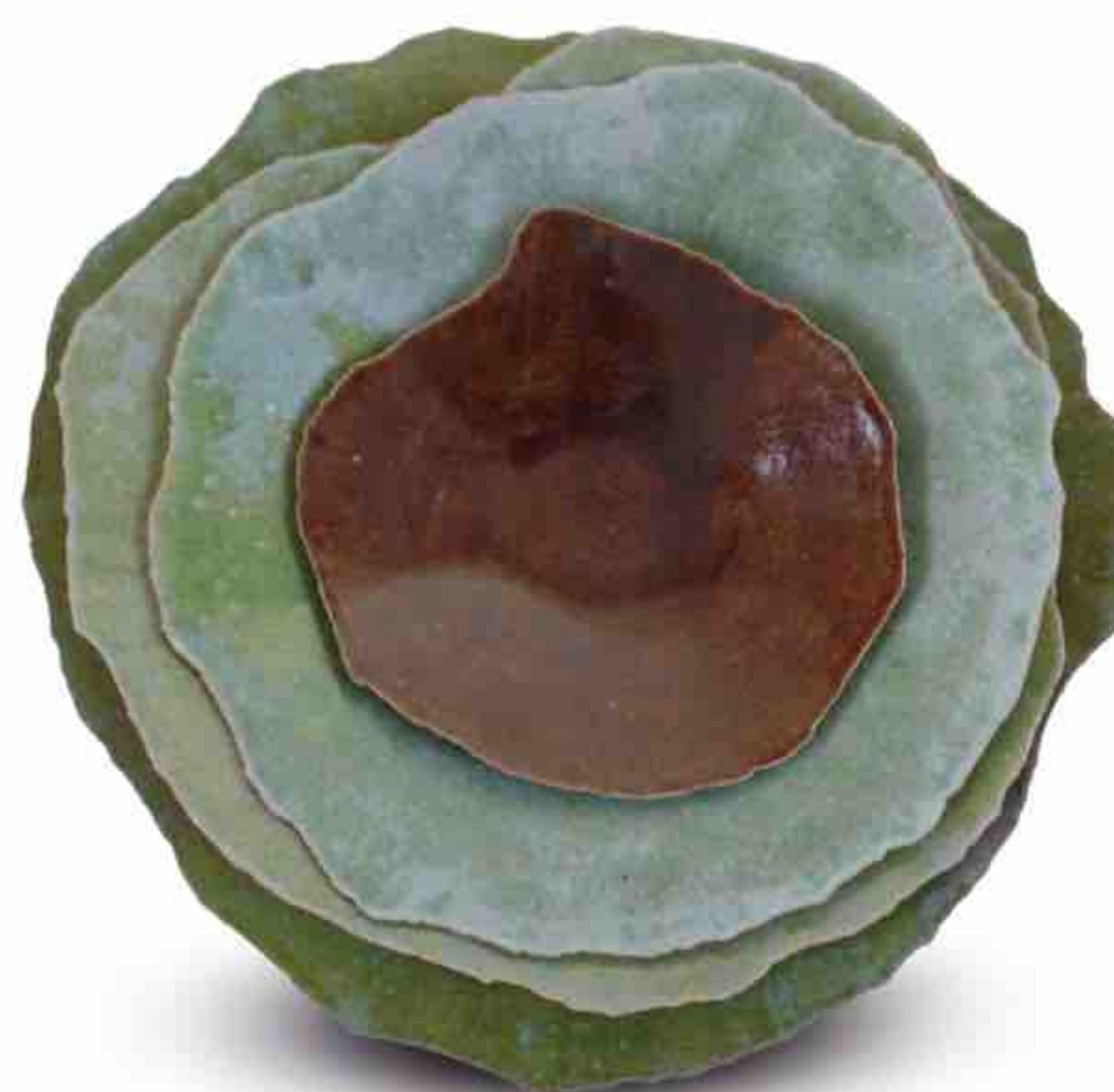
← Série En couleur NATHALIE SONNET Grès modelé émaillé Ø 50 cm (grand modèle): 520 € Ø 20 cm (petit modèle): 50 €