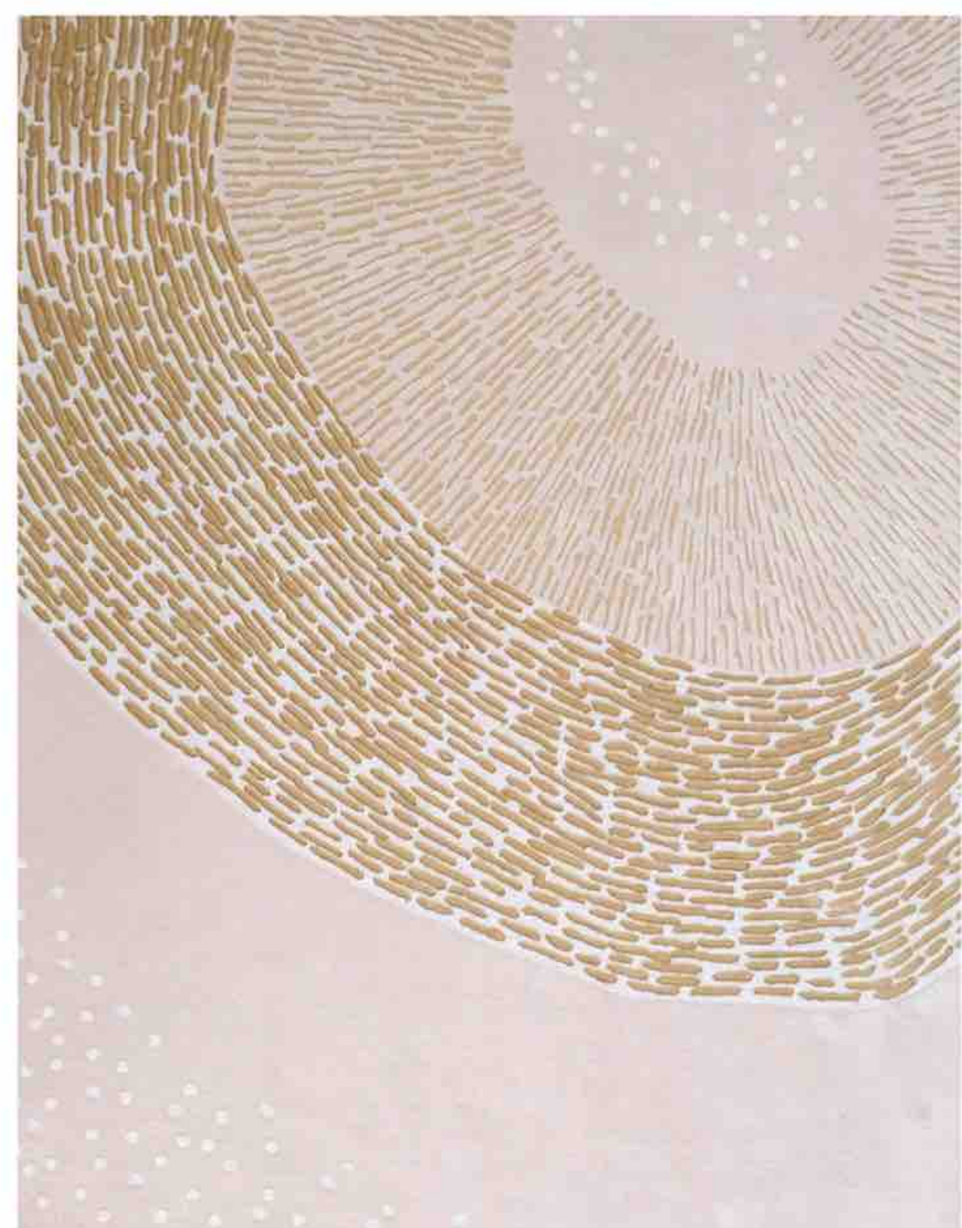
→ Tapis Caldeira - design d'Elsa Barbillon MANUFACTURE DE TAPIS DE BOURGOGNE Laine et soie, tufté main Sur mesure Prix: sur demande