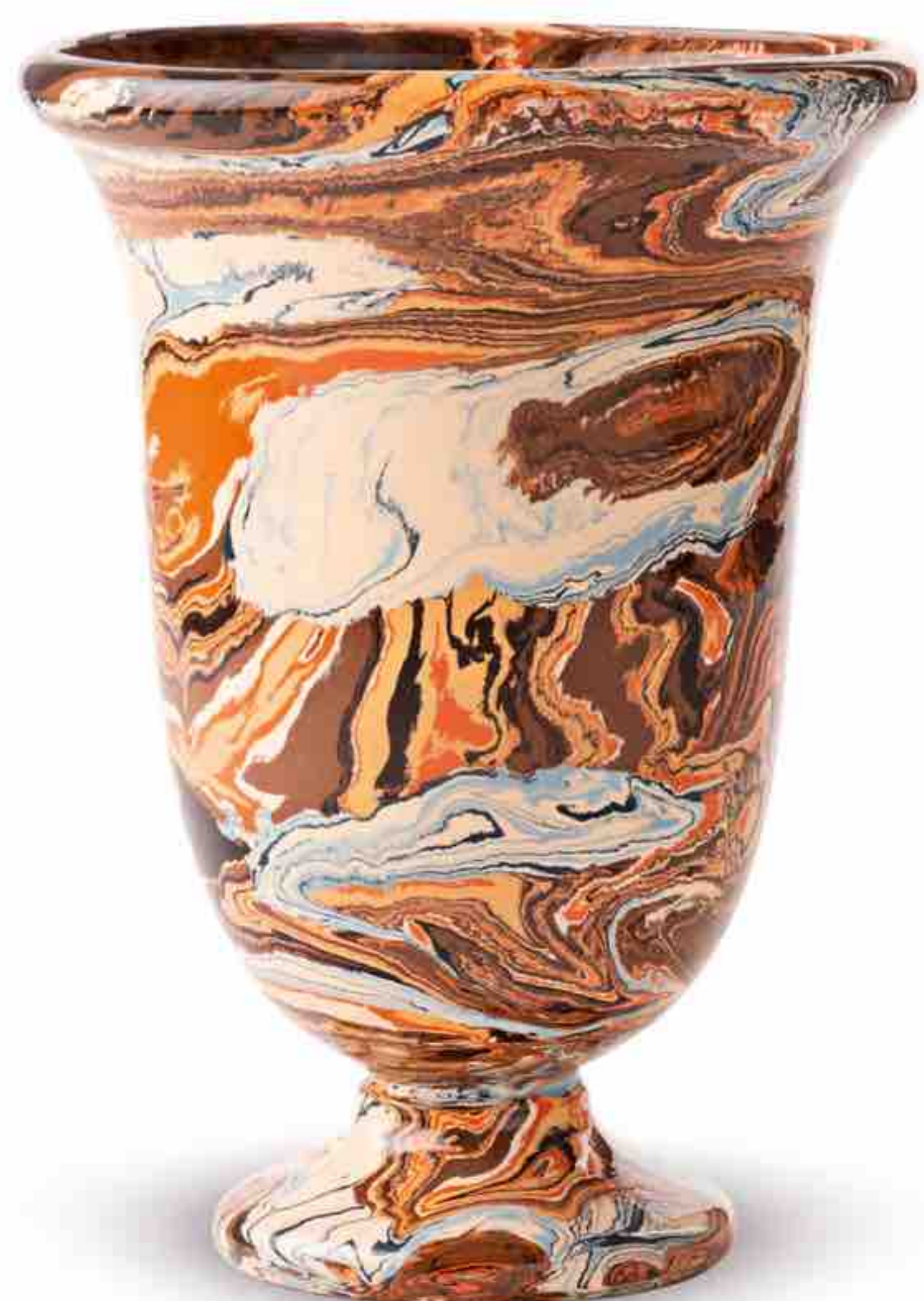
↑ Vase Médicis ATELIER SAINT ANDRÉ PERRIN Terres mêlées H. 30 cm, Ø 22,5 cm Prix: 1 000 €