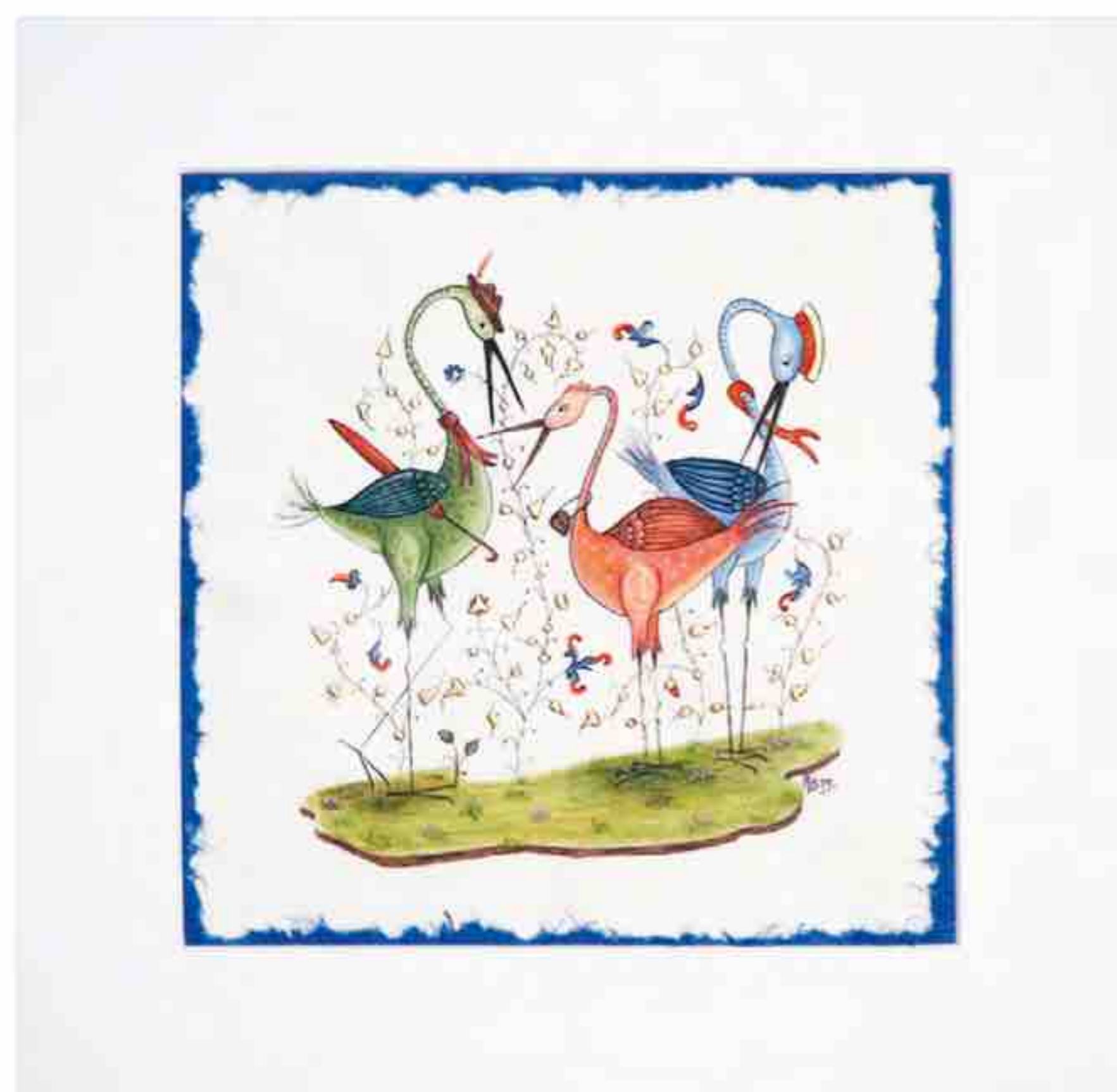
↑ Enluminure Élégance ANNIE BOUYER Parchemin de chèvre, feuille d'or (22 carats), pigments minéraux et végétaux 34 x 34 cm Prix: 360 €